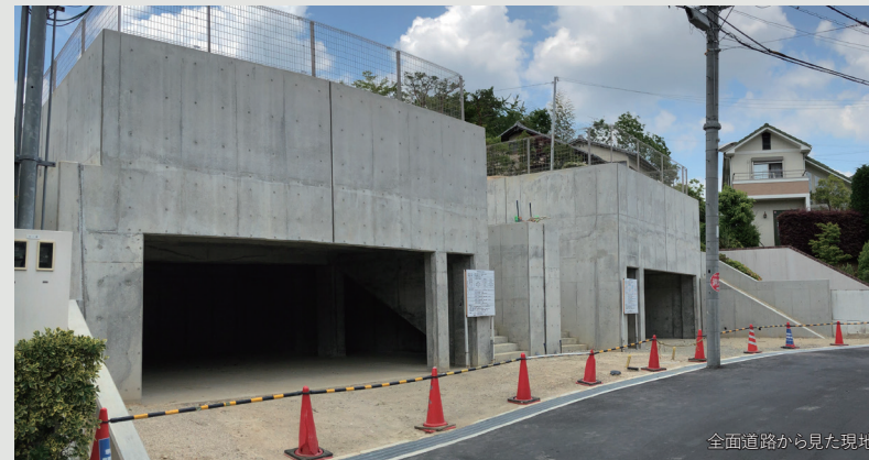
全面道路から見た現地

高低差のある立地、更にボックスガレージを最大限に活かした魅力あふれるプランをご提案いたします。