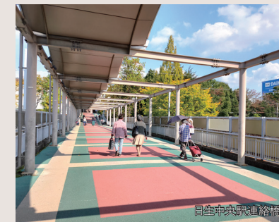
日生中央駅連絡橋

敷地面積... 600.44 m 2 (181.63坪) 土地価格... 15,000 万円