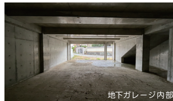
地下ガレージ内部